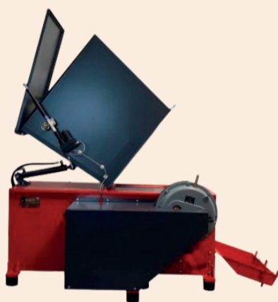
ДРОБАРКА СЕРІЇ RJ