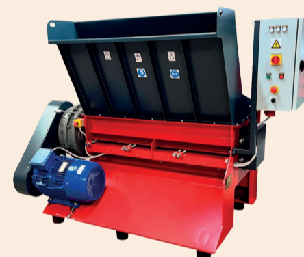
ДРОБАРКА СЕРІЇ RJG