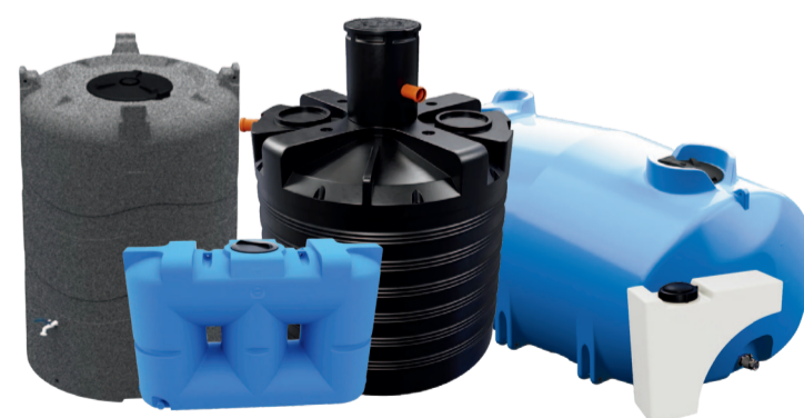
РЕЗЕРВУАРИ ДЛЯ ВОДИ

Потрібна допомога у виборі резервуара? Відвідайте наш магазин www.taniezbiorniki.pl . Напишіть нам електронного листа або зателефонуйте, і ми допоможемо вибрати