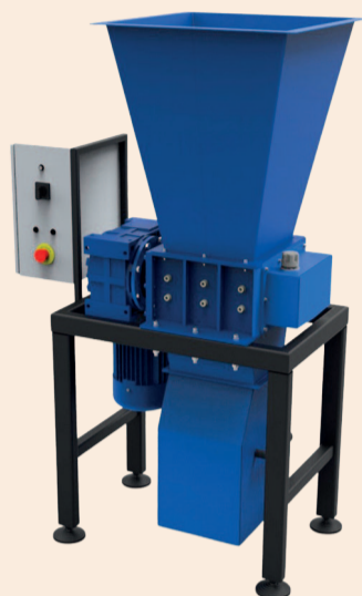
ДРОБАРКА СЕРІЇ RF-137