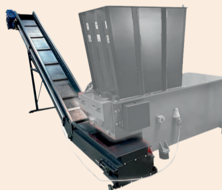
СТРІЧКОВИЙ КОНВЕЙЄР, ЩО МОЖЕ ЗГИНАТИСЯ