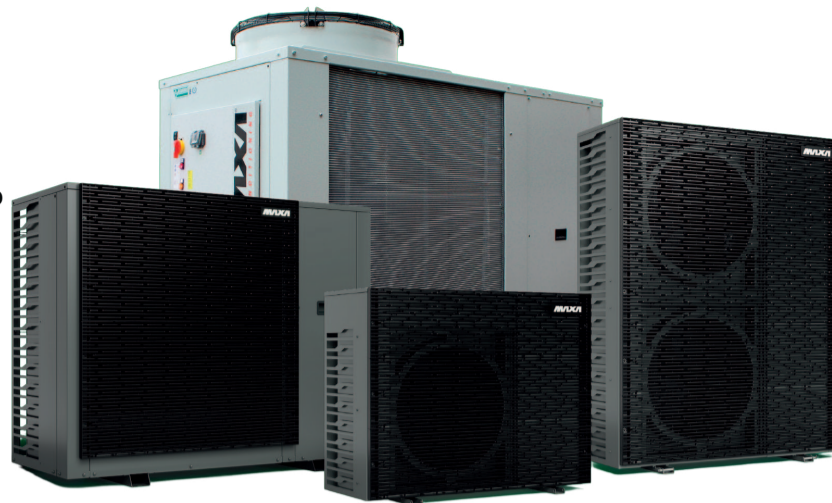
Теплові насоси та чиллери як для односімейних будинків, так і для промислових закладів від 6 до 170 кВт