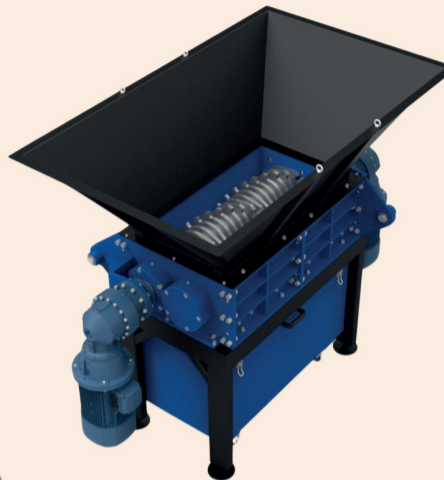
ДРОБАРКА СЕРІЇ RF-290