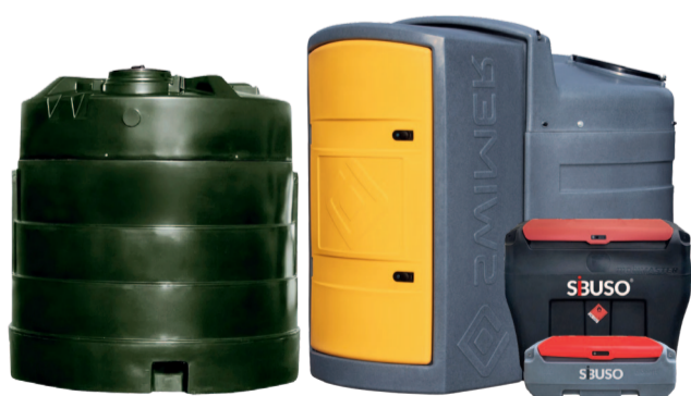
РЕЗЕРВУАРИ ДЛЯ ПАЛИВА ТА МАЗУТУ