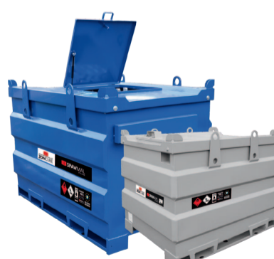
СТАЛЕВІ РЕЗЕРВУАРИ ДЛЯ ПАЛИВА