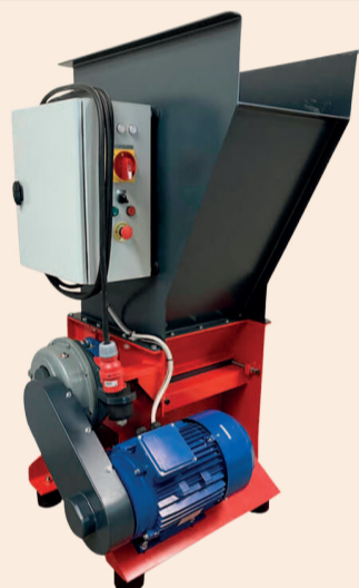
ДРОБАРКА СЕРІЇ RJ-260