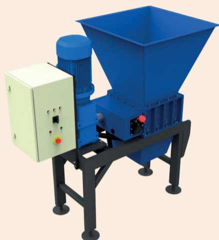
ДРОБАРКА СЕРІЇ RF-195